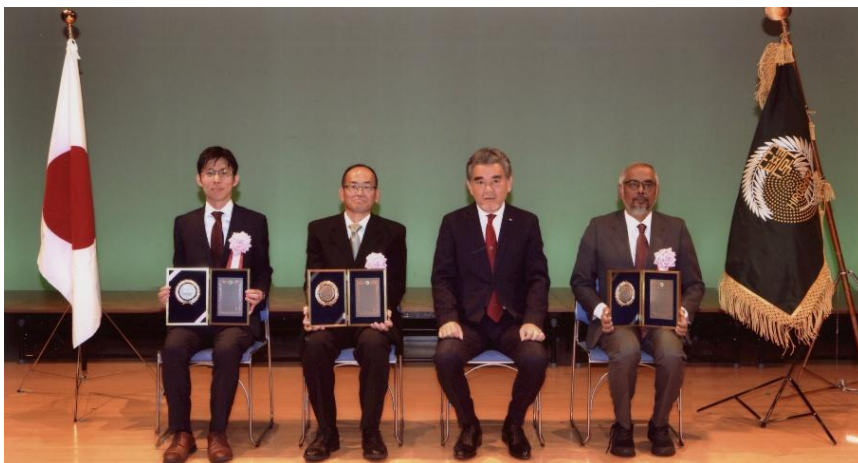
広島大学長表彰授与式 令和7年11月1日 於 サタケメモリアルホール

表彰授与式は2025年11月1日開催の大学祭・ホームカミングデーのオープニングセレモニー内で執り行われました。